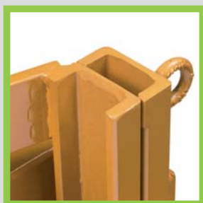
Profili in acciaio laminati a caldo Hot-rolled steel profiles