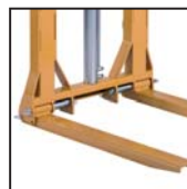
Forche pieghevoli e regolabili Adjustable and pliable forks