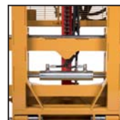
Traslatore laterale Side shift