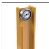
Cuscinetti radiali a rulli cilindrici Straight roller radial bearings